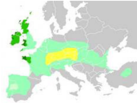
Expansió dels celtes des dels Alps

equivalent a la posterior Narbonensis i, finalment, una Gàl·lia Comata on es barrejaven territoris de les actuals Bèlgica, França, Holanda i Alemanya fins a la frontera en el riu Rin. Tots els habitants d'aquestes Gàl·lies eren, per definició, gals.